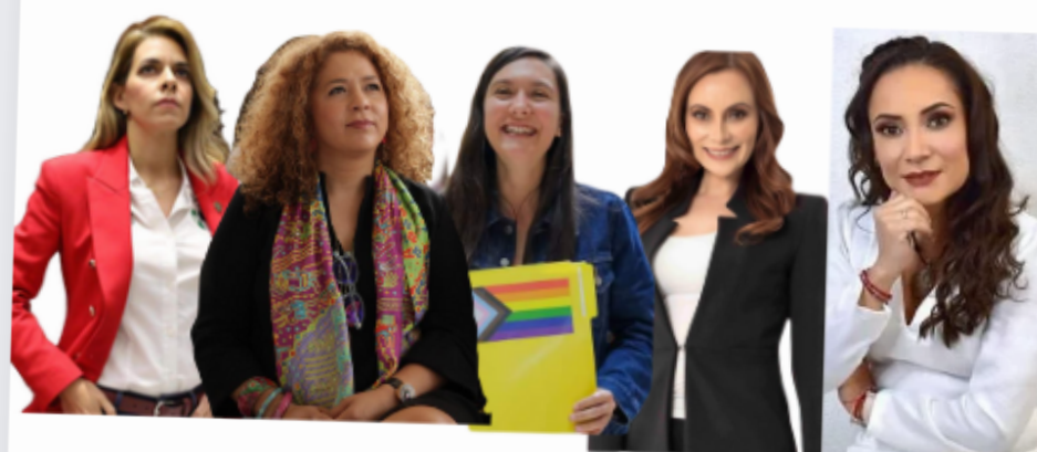
Presidenta PRI Presidenta PRD Presidenta Futuro Presidenta PAN Presidenta Morena

POR 1ERA VEZ LA MAYORIA DE LOS PARTIDOS SON PRESIDIDOS POR MUJERES